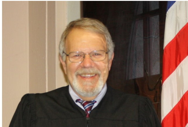
Judge Chancey C. Crowell