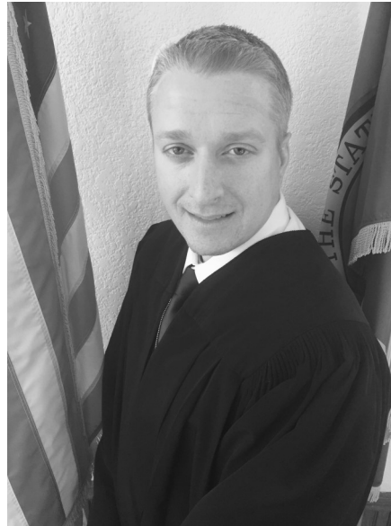
Judge Charles D. Short

Una vez que el dictamen haya sido apelado en la Corte Superior, la ejecución de cualquier obligación ordenada en el caso será tramitada en la Corte Superior de la misma manera que todo otro mandato de la Corte Superior.