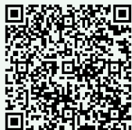
Google Play Store