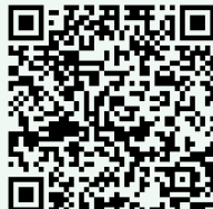
Apple App Store

Tenga en cuenta que la hora de recogida dependerá de la ubicación de la camioneta y del número de recogidas y/o desembarques que el conductor deba realizar al momento de solicitar el viaje. Una recogida, generalmente dentro de un margen de 45 minutos, se considera puntual.